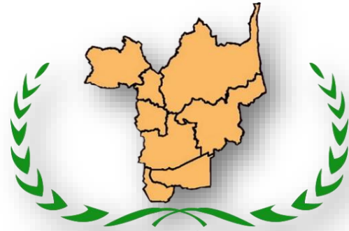
เครือข่ายวิจัยเครือข่ายอุดมศึกษาภาคกลางตอนบน

เครือข่ายเชิงประเด็นด้านการวิจัย เริ่มดำเนินการอย่างเป็นทางการเมื่อปี พ.ศ. 2547 พันธกิจหลักที่สำคัญ คือการพัฒนาท้องถิ่นบนฐานความรู้ โดยใช้กระบวนการวิจัย เป็นเครื่องมือการทำงาน ควบคู่กับการพัฒนาบุคลากรด้านการวิจัย สร้างทุนปัญญาให้กับชุมชน มุ่งสู่เวทีการแข่งขันของประเทศสู่สากล และนำไปสู่การพัฒนาอย่างยั่งยืน